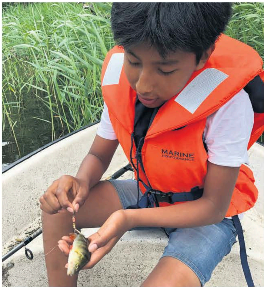
Sidste sommer holdt Morud Lystfiskerforening en juniordag ved Langesø, hvor alle kunne få lov til at prøve at fiske. Succesen bliver gentaget igen i år 12. juni.