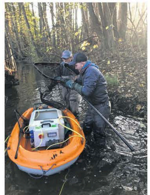
Hvert år udsættes omkring 500.000 havørre der på Fyn i form af yngel, og hvert efterår hjælper medlemmer fra Morud Lystfiskerforening med at fange havørredunner og -hanner, som kan være med til at sikre ynglen. Fiskene afleveres på Elsesminde Produktionshøjskole til produktion af ørredyngel. Foto: Morud Lystfiskerforening

- Hvem er stolt? Mig? Der var mange glade og stolte børn på Langesø, da Morud Lystfiskerforening holdt juniordag sidste sommer. Foto: Morud Lystfiskerforening