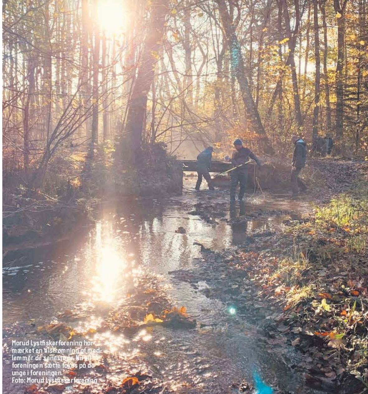
Morud Lystfiskerforening har mærket en tilstrømning af medlemmer de seneste år. Nu vil foreningen sætte fokus på de unge i foreningen.